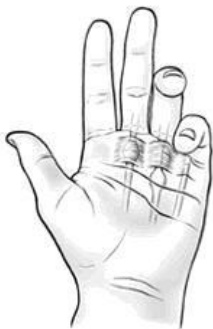
Figuur 1. Schematische weergave trigger finger