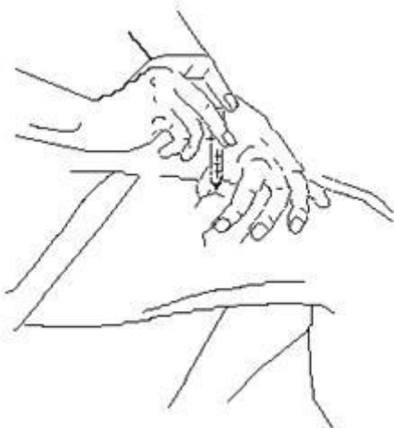
Figuur 2. Het opnemen van een huidplooi in uw bovenbeen

Bij langdurige toediening moet regelmatig van prikplaats gewisseld worden omdat het steeds op dezelfde plaats injecteren de werking van het medicijn vermindert. Er kan op de prikplaats namelijk bindweefselvorming ontstaan (voelt als een harde schijf). Het toegediende medicijn kan dan niet meer goed opgenomen worden waardoor er steeds hogere doseringen nodig zullen zijn om hetzelfde effect te bereiken.