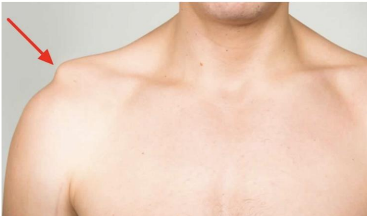
Figuur 1. AC luxatie

De banden worden ook wel ligamenten genoemd en kunnen in verschillende mate afgescheurd zijn waardoor het sleutelbeen zichtbaar is zoals in Figuur 1.