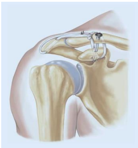
Figuur 3. AC reconstructie

De hamstring pezen worden met behulp van een huidsnede ter hoogte van de knie verwijderd. Een voorbeeld van het eindresultaat waarbij de pezen het sleutelbeen weer op zijn plek houden ziet u in figuur 3.