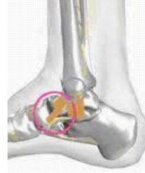
Figuur 3. Schematische weergave van het enkelgewricht