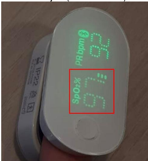
Figuur 1. Saturatiemeter voorbeeld (waarde zuurstofsaturatie is 97).

In Figuur 1 ziet u een foto van de saturatiemeter. De waarde van de zuurstofsaturatie is rood omlijnd (waarde is 97).