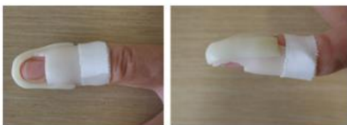
Foto 2a: Malletspalk

In deze periode is het van belang dat het topje onder geen enkele omstandigheid buigt of uit de strekking gehaald wordt. De pees en het littekenweefsel zijn dan nog niet sterk genoeg waardoor deze opnieuw los getrokken worden. Dit betekent dat de spalkperiode opnieuw moet starten.