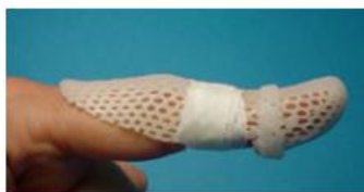
Foto 2b: Sonneveldspalk