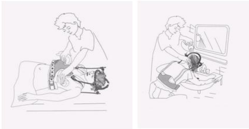
Figuur 3. Haar wassen met een Haloframe