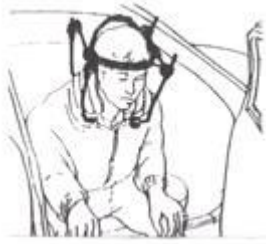
Figuur 6. Uitstappen met een Halo frame

Houd bij in- en uitstappen rekening met de hoogte van het frame en de daklijst van de auto.