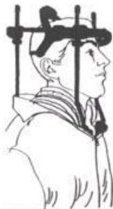
Figuur 4. Kleding voor Haloframe zijaanzicht

In het voorbeeld is gebruik gemaakt van klittenband. Gebruik van ritsen, drukkers of haakjes is natuurlijk ook mogelijk.