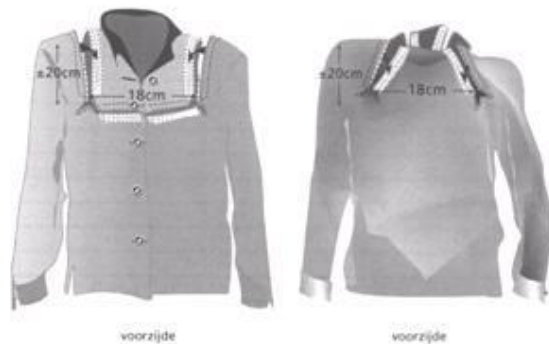
Figuur 3. Kleding voor Haloframe

Patroon is voor voor- en achterzijde hetzelfde.