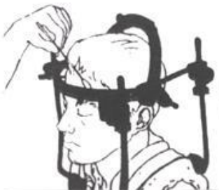
Figuur 2. Verzorging van Haloframe

Het is belangrijk dat deze verzorging ook thuis gebeurt. Dit kan door iemand bij u thuis gedaan worden. Lukt dit niet dan wordt de thuiszorg voor u ingeschakeld.